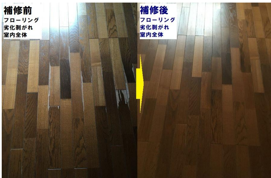
補修後 フローリング 劣化剥がれ 室内全体