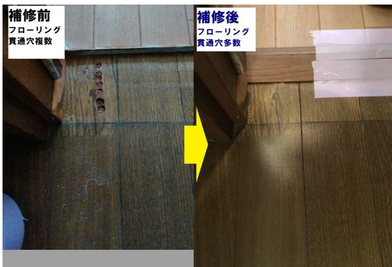
補修後 フローリング 貫通穴多数